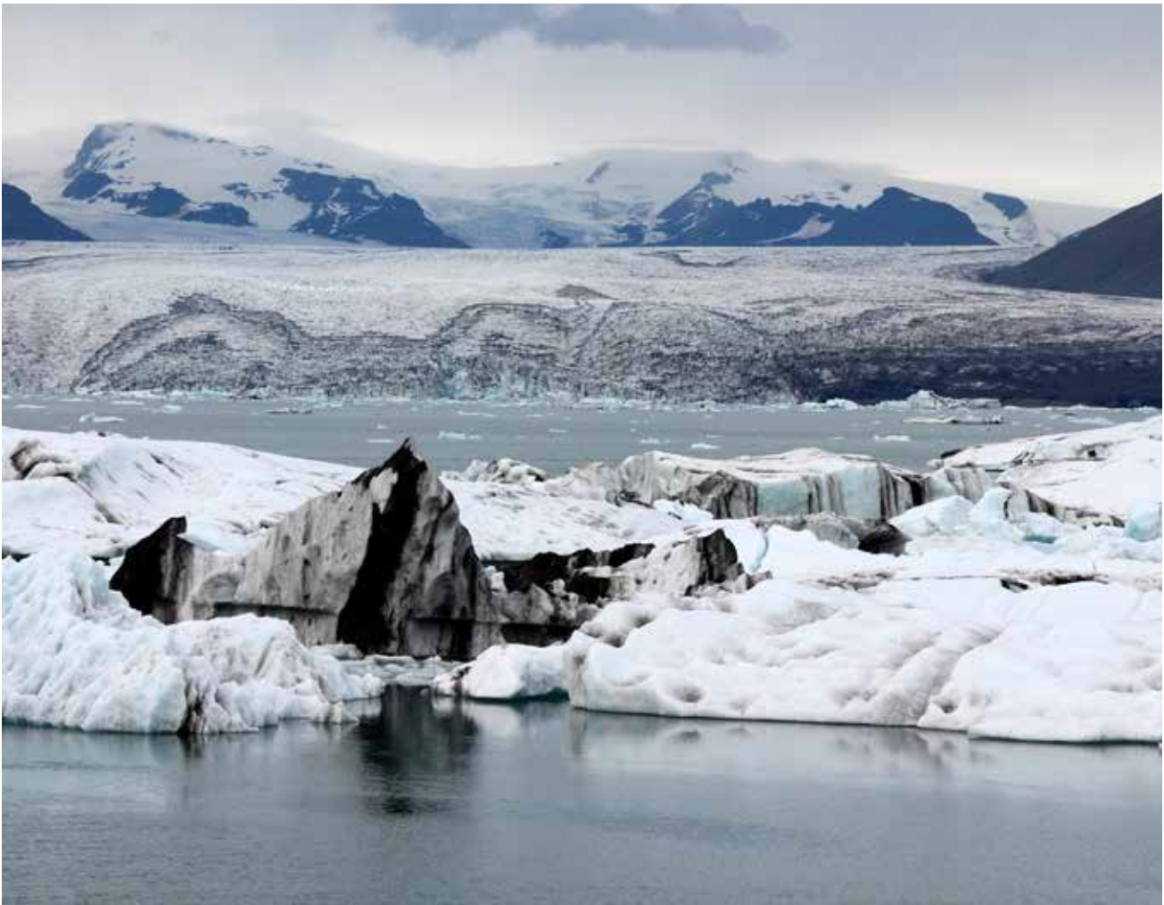
1 Schmelzen die Gletscher, drohen Überschwemmungen. Haftet RWE für die Schutzvorkehrungen?

USA – ist die Bindung an Präzedenzfälle formell anerkannt, de facto wirkt sie jedoch auch in Deutschland.