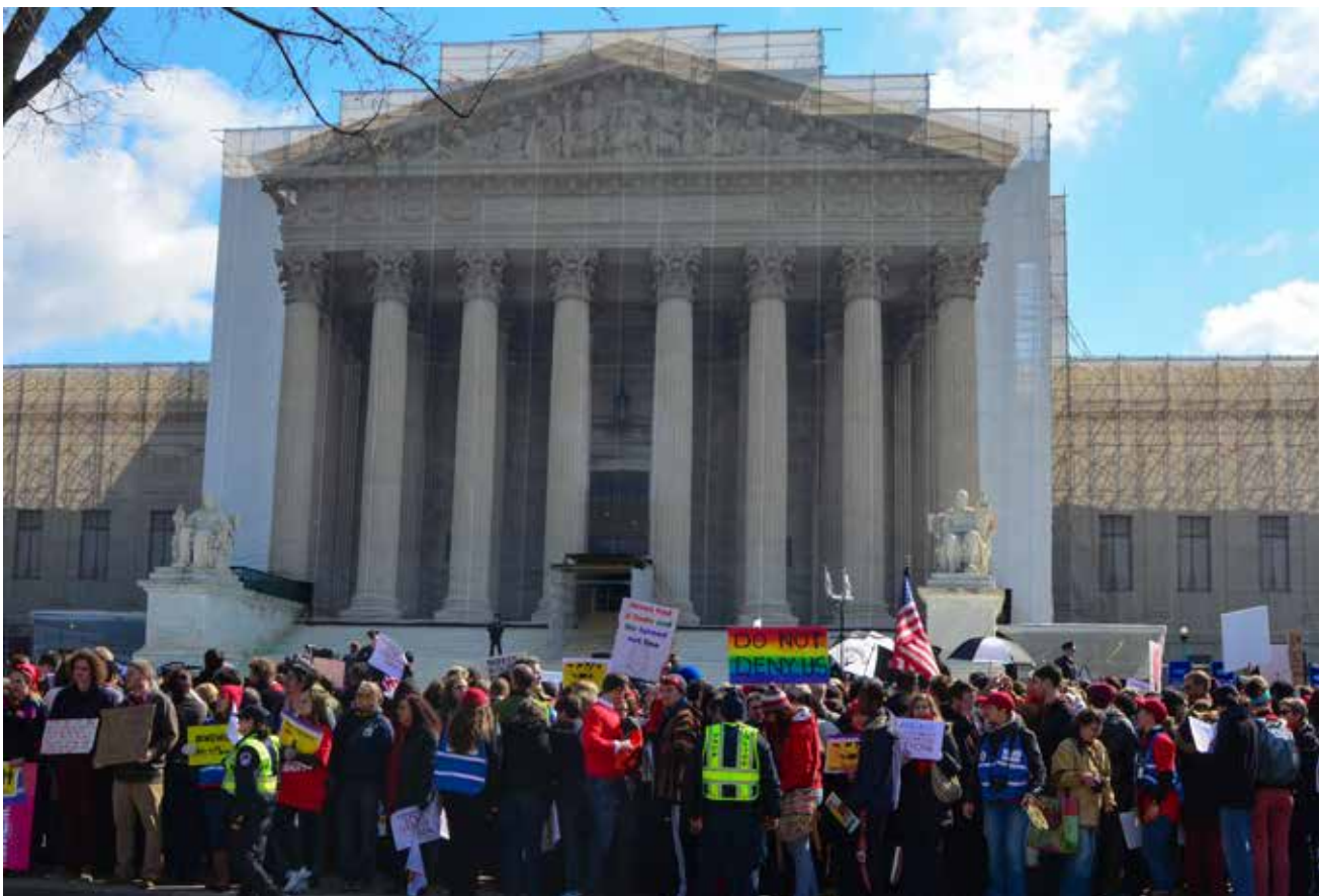
2 Demonstranten vor dem US Supreme Court: Im Mutterland der Strategic Litigation sind die Grenzen zwischen Politik und Recht fließend. Credit/Foto: angela n. ( https://www.flickr.com/photos/aon/ ) Lizenz: CC BY 2.0 ( https://creativecommons.org/licenses/by/2.0/legalcode )

Vielleicht noch häufiger aber werden in strategischen Verfahren Missstände von transnationaler Tragweite aufgegriffen: Medikamententests westlicher Pharmakonzerne in den Armutsregionen des globalen Südens, Arbeitssicherheit in den dortigen Zulieferbetrieben, die Förderung völkerrechtswidriger Drohneneinsätze gegen vermutete Terrorzellen in der arabischen Welt, das Grenzregime an den EU-Außengrenzen – dies nur ein kleiner Querschnitt durch die Aktivitäten des in Berlin ansässigen European Center for Constitutional and Human Rights (ECCHR), der führenden unter den hiesigen „strategic litigation“-Organisationen.