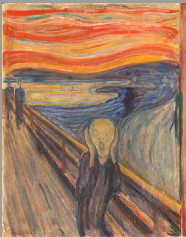
Edvard Munch: The Scream